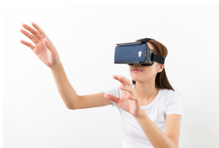
Eine interessante Erfahrung, aber auch ein mögliches Datenrisiko: VR-Brillen

Je nach Anbieter können Sie sogar Ihr Online-Profil von Facebook oder einem anderen so-