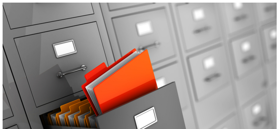
Im Normalfall haben behördliche Sperrvermerke keine Auswirkungen auf die Behandlung der betroffenen Daten im Unternehmen. Es gibt aber Ausnahmen.

Das gilt auch, wenn "befreundete Unternehmen" anfragen, die ebenfalls nach der aktuellen Anschrift suchen.